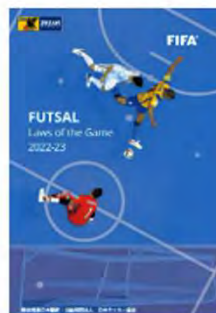
フットサル競技規則2022/23

審判員に向けた競技規則の補足情報となる実践的アドバイスなどを、Webページ形式で確認できます。