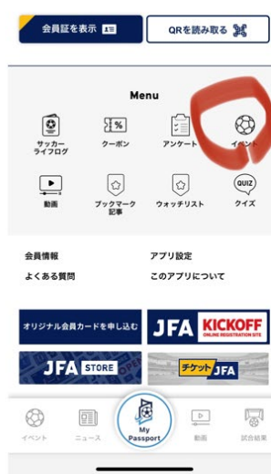
イベントボタンをクリックします