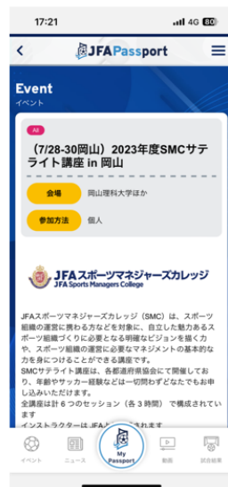
イベントページが表示されるので 一番下までスクロールします