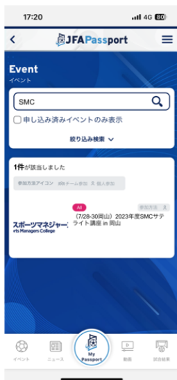
SMCサテライト講座inXXが 出てくるのでクリックします