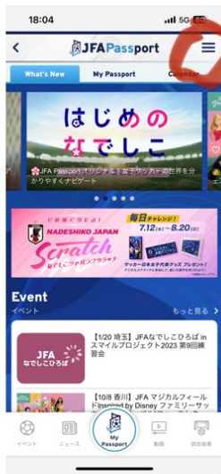
JFA Passportログイン後右上のメニューボタンをクリックします