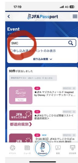
検索画面でSMCと入力します